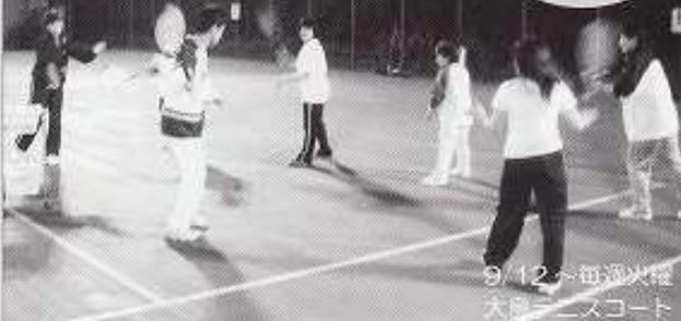
9/12 毎週火曜 大島テニスコート

前回好評につき、ナイターテニスもパート 2 が始まりました。天気に恵まれ、テニスコートを使える日が多く、これで上達しなきゃうそですよ。けっこうラリーも続くようになったし、どこかで腕試ししてみたいなあ。そんな声も出始めた教室です。