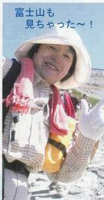
富士山も 見ちゃった～!