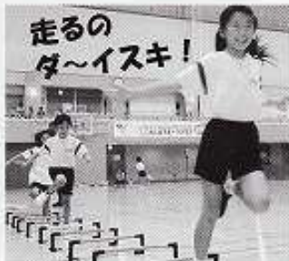
9/13 ~ 10/18 毎週火曜