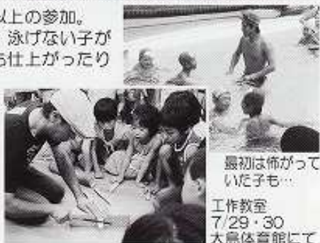
最初は怖がっていた子も…